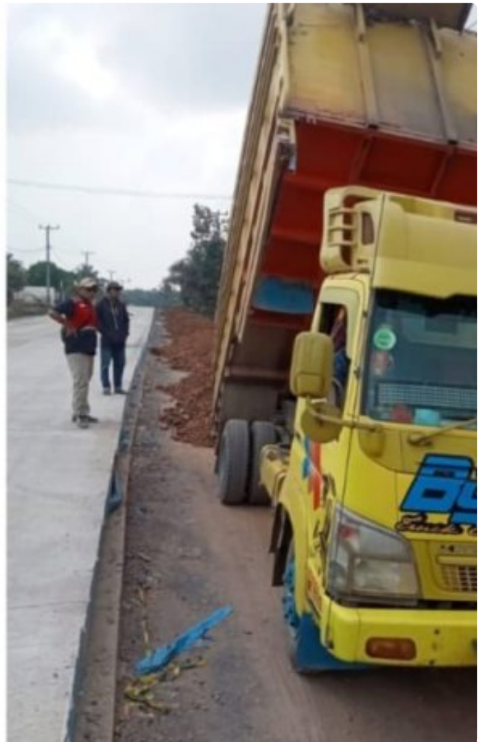
Mobil Pengangkut Tanah Galian C